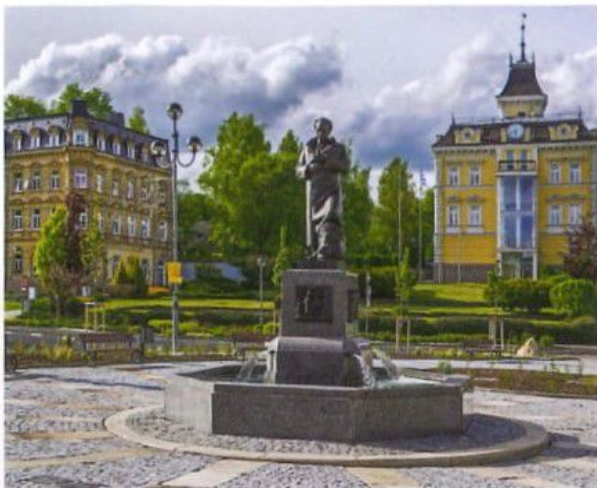
Goethovo náměstí, kde pomocí aplikace Time Trip můžete cestovat časem / Goethe Platz wo kann man mit Time Trip App durch die Zeit reisen