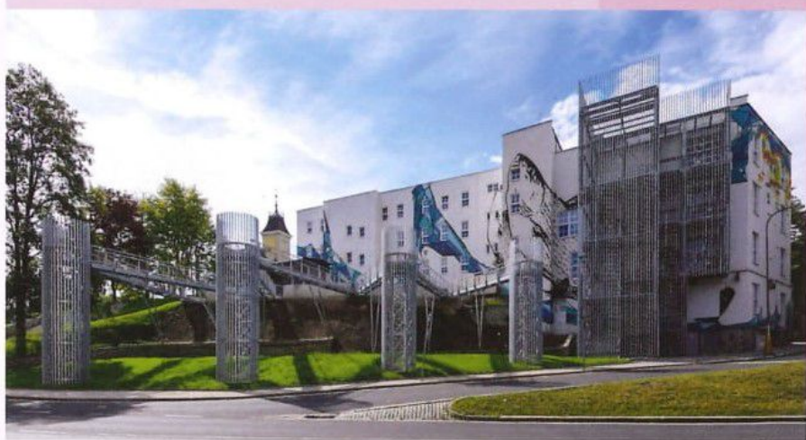
Kulturní centrum La Ritma / Kulturhaus La Ritma