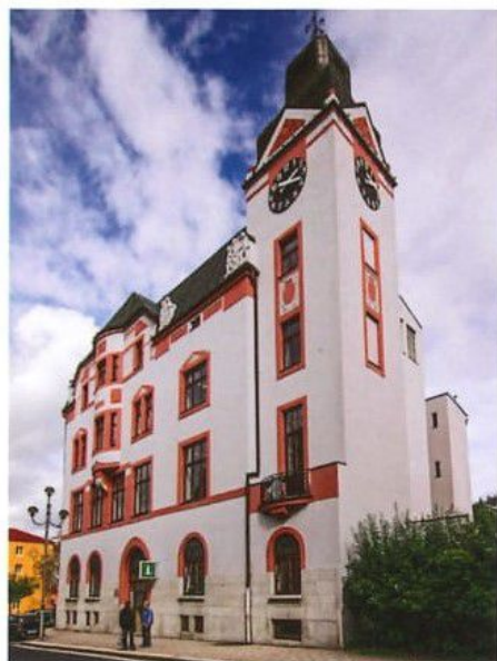
Městská knihovna a informační centrum Aš / Stadtbibliothek und Tourist Information