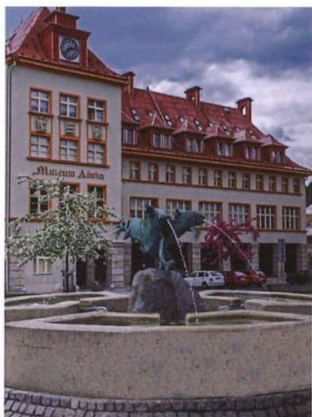
Muzeum Ašska a kašna s lipany / Ascher Muzeum